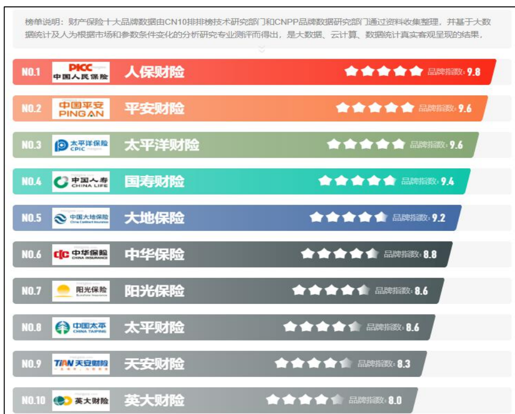
图2 CN10/CNPP-2021年财产保险十大品牌榜中榜