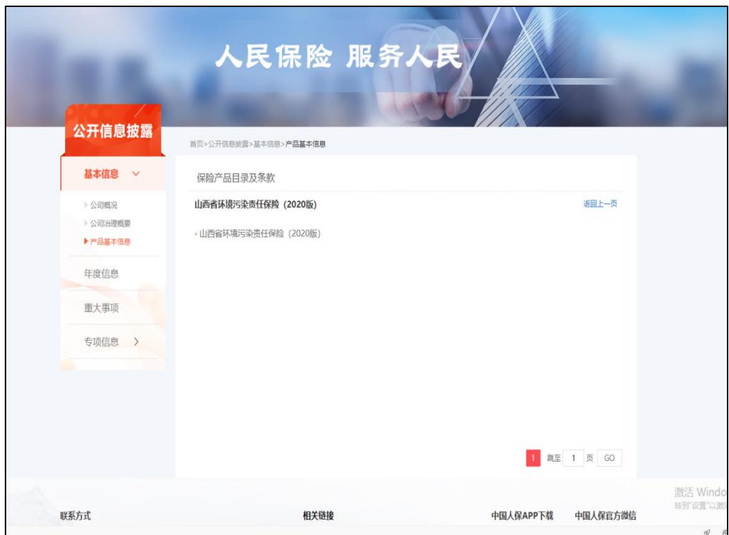
图 4 产品基本信息中有山西省环境污染责任保险（2020版）