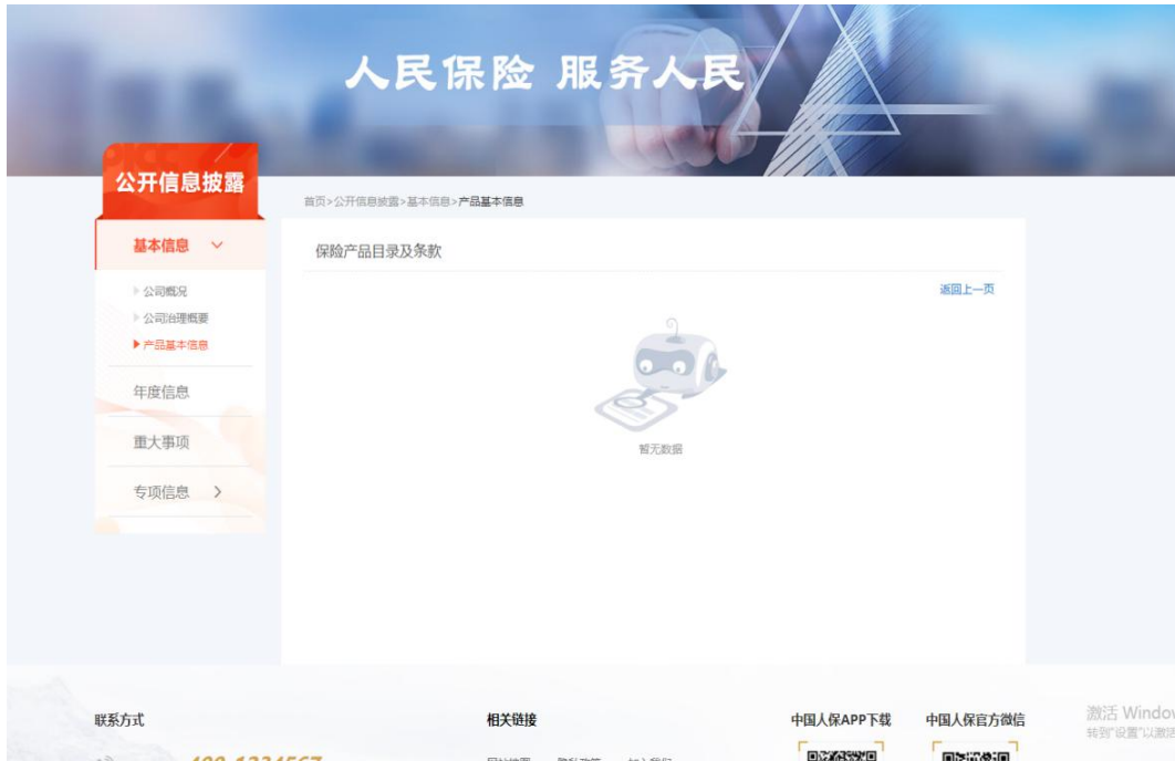
图5 山西省环境污染责任保险（2020版）点开显示“暂无数据”

针对上述情况，绿色江南分别于2021年7月27日、7月28日、8月24日及8月26日通过致函的方式对5家保险公司进行友好提示，其中太平财险由于收件人不详退件，于8月9日重新寄出。9月8日，绿色江南收到人保财险的邮件回复，称感谢绿色江南的提醒，函件中提到的两个保险条款前端显示无数据是由于系统更新不及时导致，目前人保财险正抓紧进行系统优化，并在邮件中附上人保财险最新的环境污染责任保险（B款）（2019）及山西省环境污染责任保险（2020）的条款。截至报告发布，绿色江南暂未收到其他4家保险公司的回复。