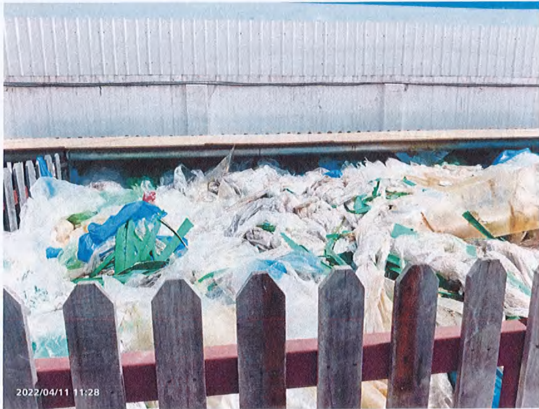
一般固废贮存场所内废旧塑料薄膜