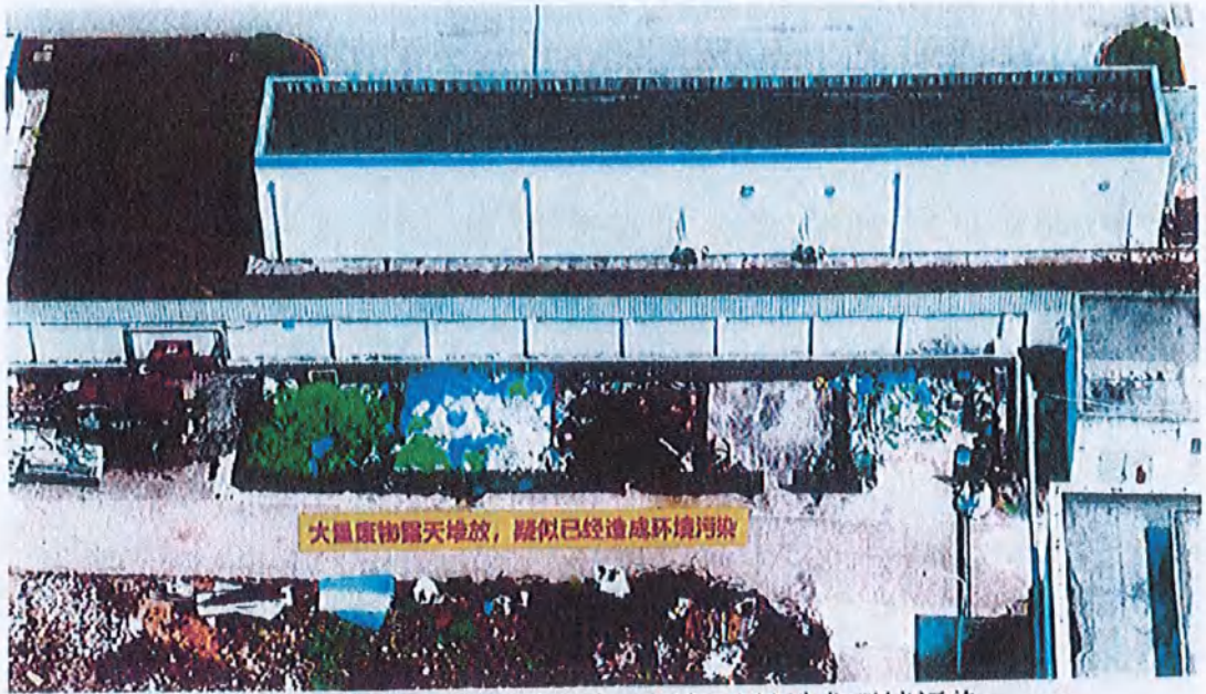
图 8、大量废物露天堆放、疑似已经造成环境污染

核实情况：图 8 为该公司南侧 60 平方米的一般固体废物贮存场所，现场检查时，该贮存场所堆放有废旧塑料打包带、废旧塑料薄膜、废铁皮和铁皮打包带，堆放较为杂乱，现场要求公司规范一般固废贮存场所的环境管理。