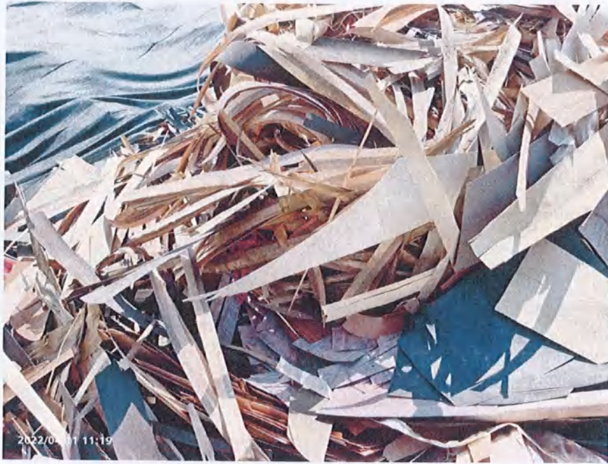
木片堆场内废木片单板细节图

调研报告中图 3 为该公司三号车间和五号车间空地，为表述方便，给图 3 中红框圈出部分进行了编号。