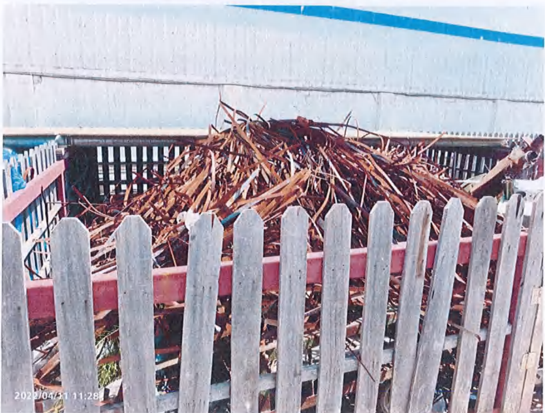
一般固废贮存场所内废铁皮和铁皮打包带