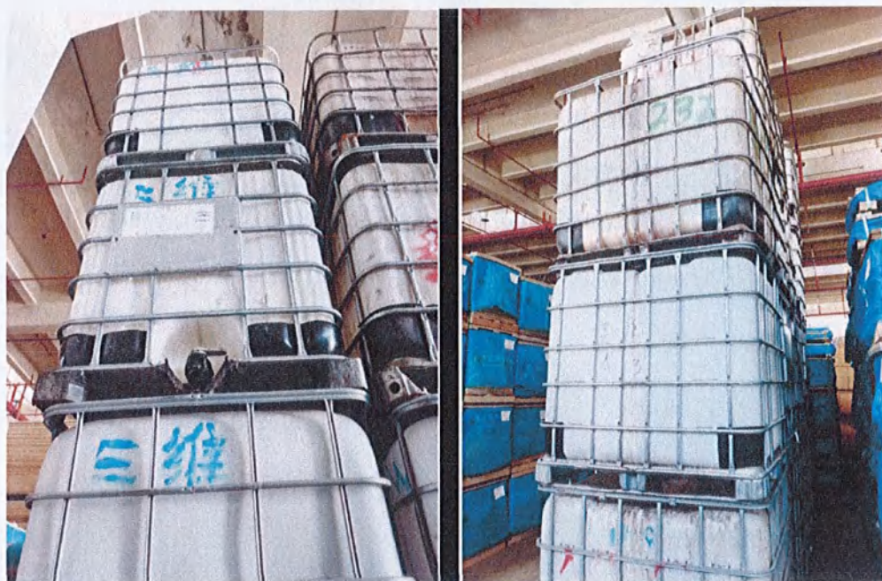
现场检查时，成品胶空桶已贮存至室内实拍图

核实情况：现场检查时，公司1号、2号位置堆放的吨桶已经转移至室内，经过进一步调查，调研报告中反映的露天堆放的吨桶均为公司在木板粘合过程中使用的成品胶的空桶，对公司露天堆放危险废物的行为，我局已立案调查。