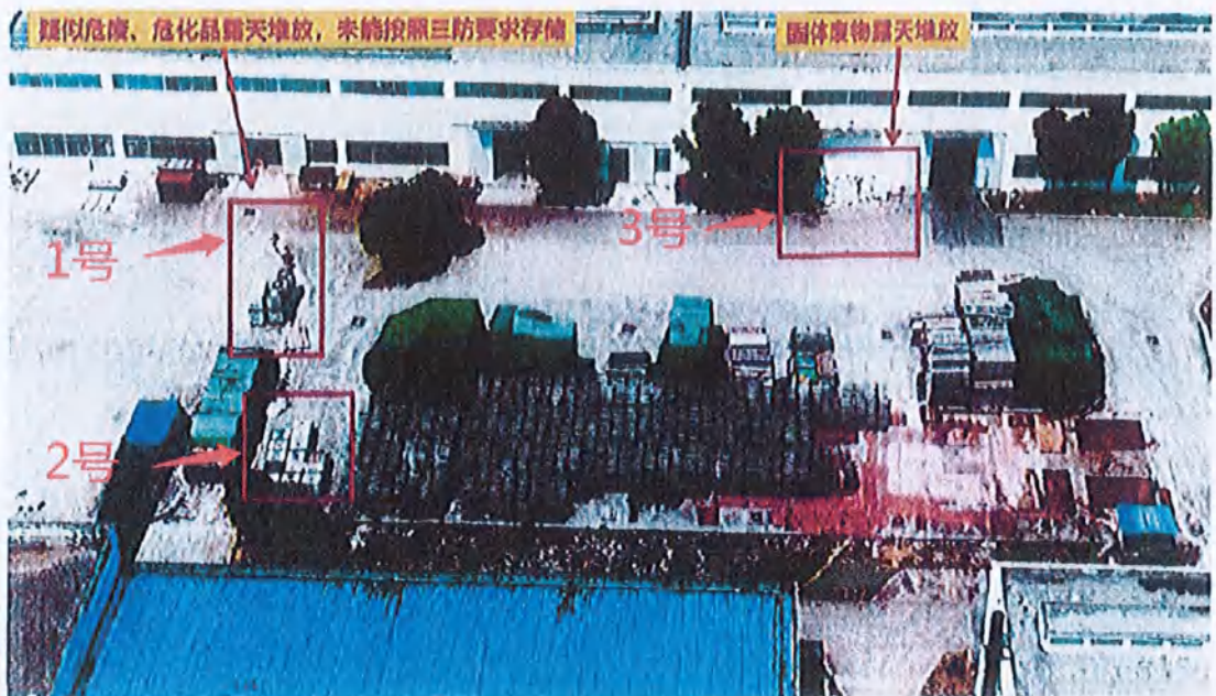
图 3、疑似危废、危化品露天堆放，未能按照三防要求存储 固体废物露天堆放

调研报告中图 3 为该公司三号车间和五号车间空地，为表述方便，给图 3 中红框圈出部分进行了编号。