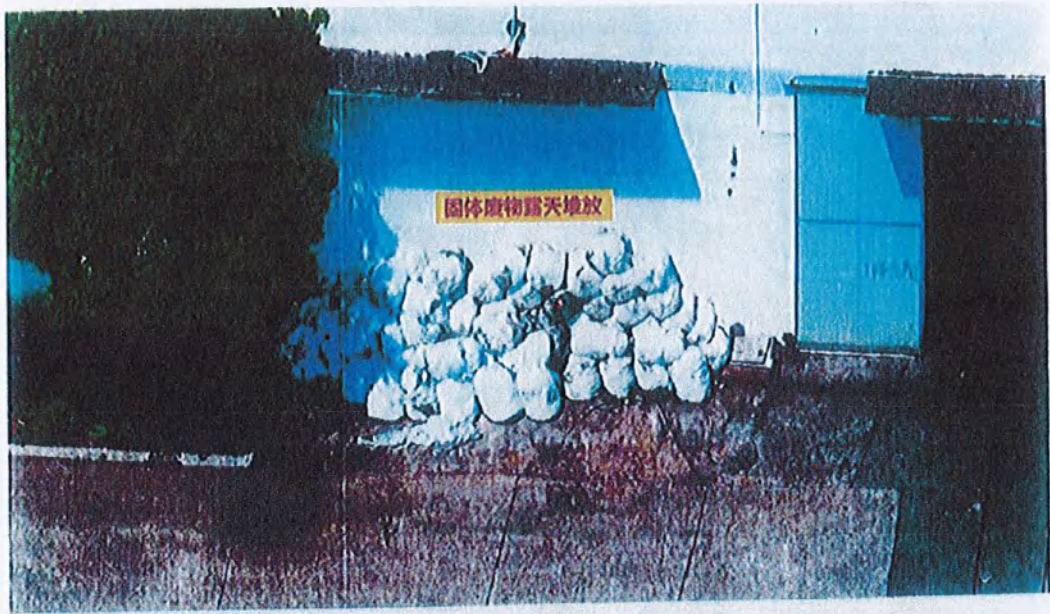
图 4、固体废物露天堆放

核实情况：该公司在包装木板过程中有废无纺布产生，公司确有产生的废无纺布临时堆放于 3 号位置，公司每周进行一次清理，废无纺布作为一般固废定期回收处理，现场检查当日，公司已完成了现场的清理工作，现场要求公司加强规范一般固废的贮存，将废无纺布放入指定贮存场所。