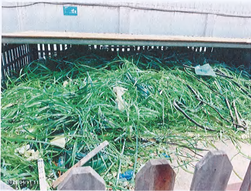
一般固废贮存场所内废旧塑料打包带