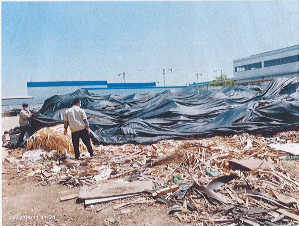
现场检查时，揭开苫盖实拍木片堆场图

积约 300 平方米，是堆放板材加工过程中废边角料（木片单板）的场所，现场检查时，堆场内堆有一定量的废木片单板，因疫情影响，该公司原定 15 天一次的清运计划稍有延迟，现场环境较为脏乱差，要求公司立即对堆场内的环境进行清理。