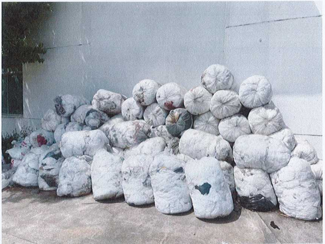
图3的3号位置废无纺布实拍图

调研报告中图5对应图3中的2号位置，图6对应图3中的1号位置，反映“疑似危废、危化品露天堆放，未能按照三防要求储存”。