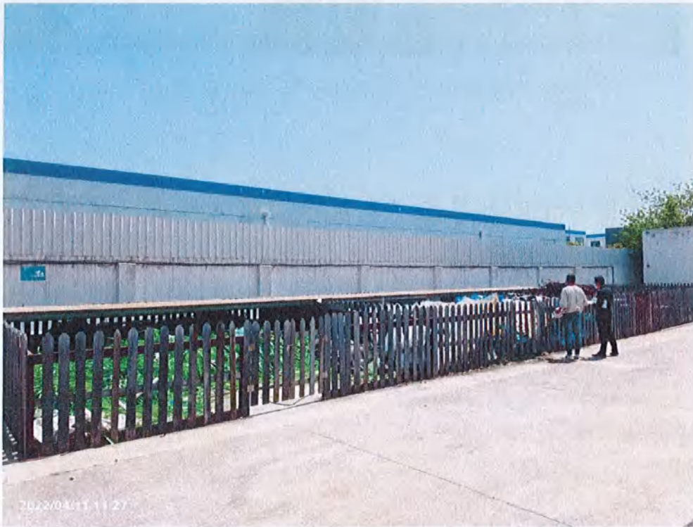
一般固废贮存场所实拍图

核实情况：图 8 为该公司南侧 60 平方米的一般固体废物贮存场所，现场检查时，该贮存场所堆放有废旧塑料打包带、废旧塑料薄膜、废铁皮和铁皮打包带，堆放较为杂乱，现场要求公司规范一般固废贮存场所的环境管理。