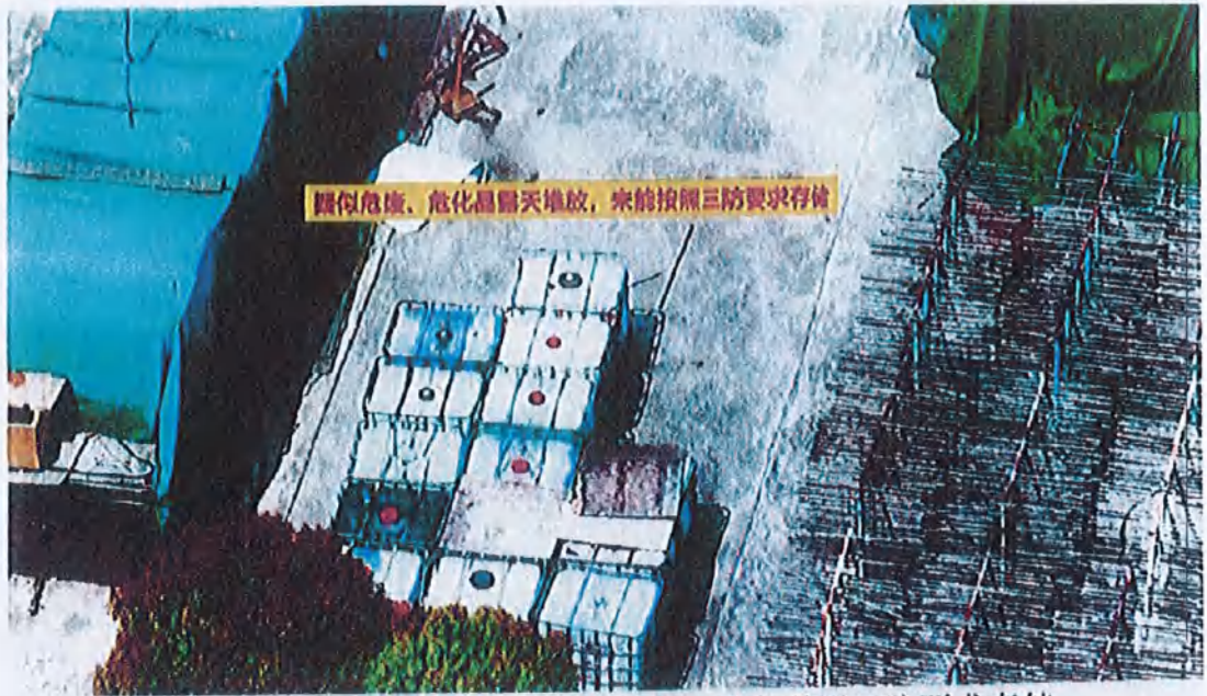
图 5、疑似危废、危化品露天堆放，未能按照三防要求存储