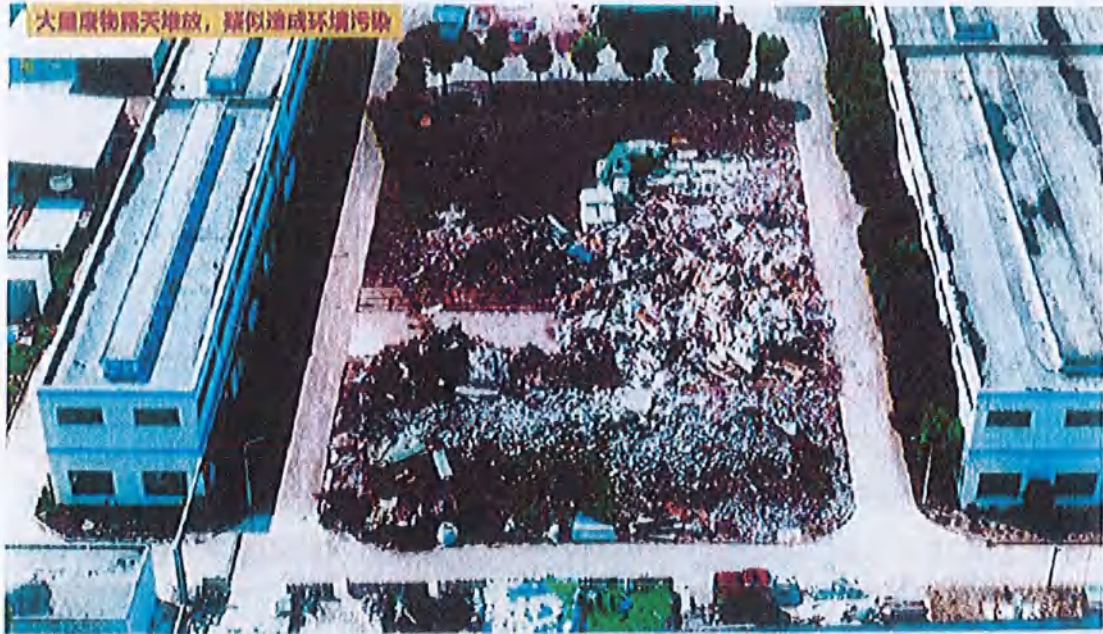
图 2、大量废物露天堆放，疑似造成环境污染