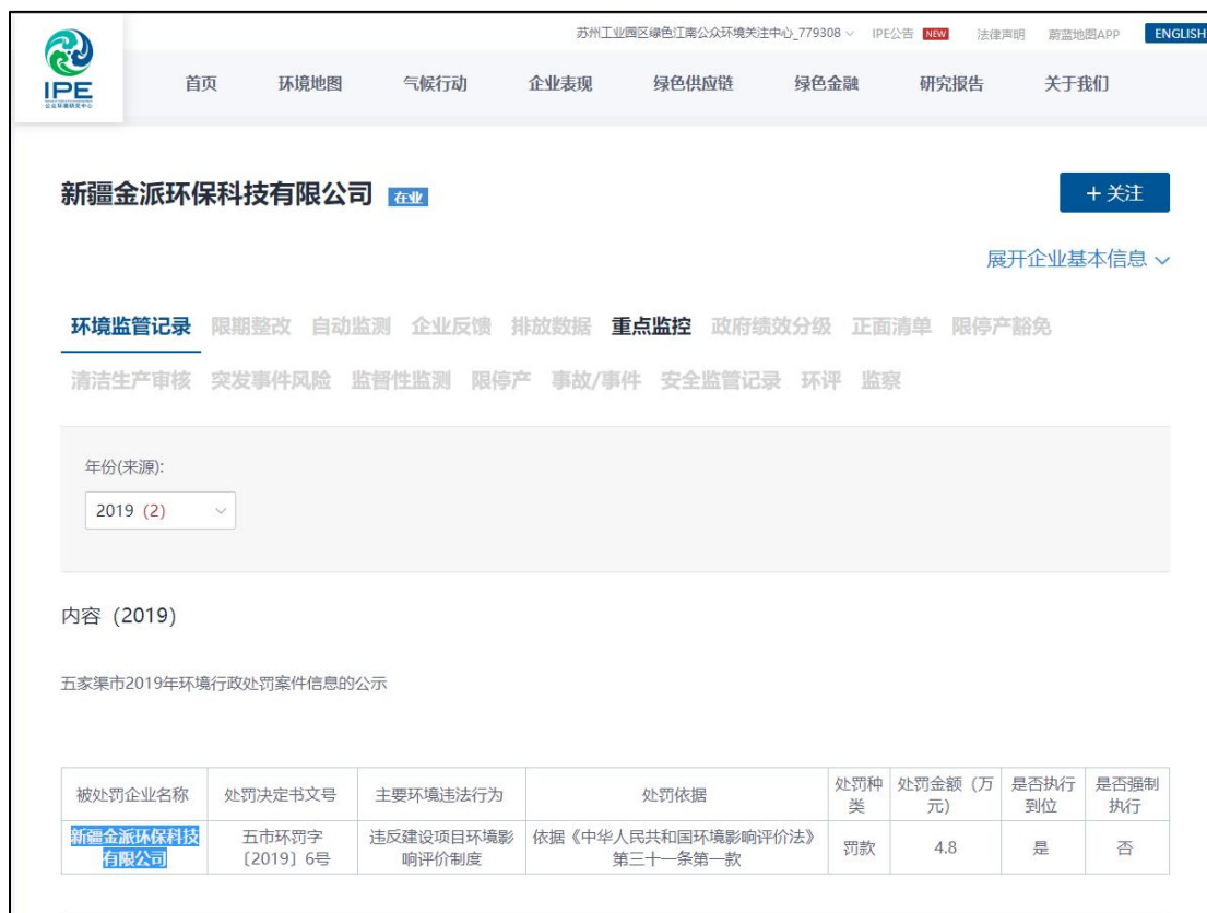
图 4 新疆金派环保科技有限公司环境监管记录情况