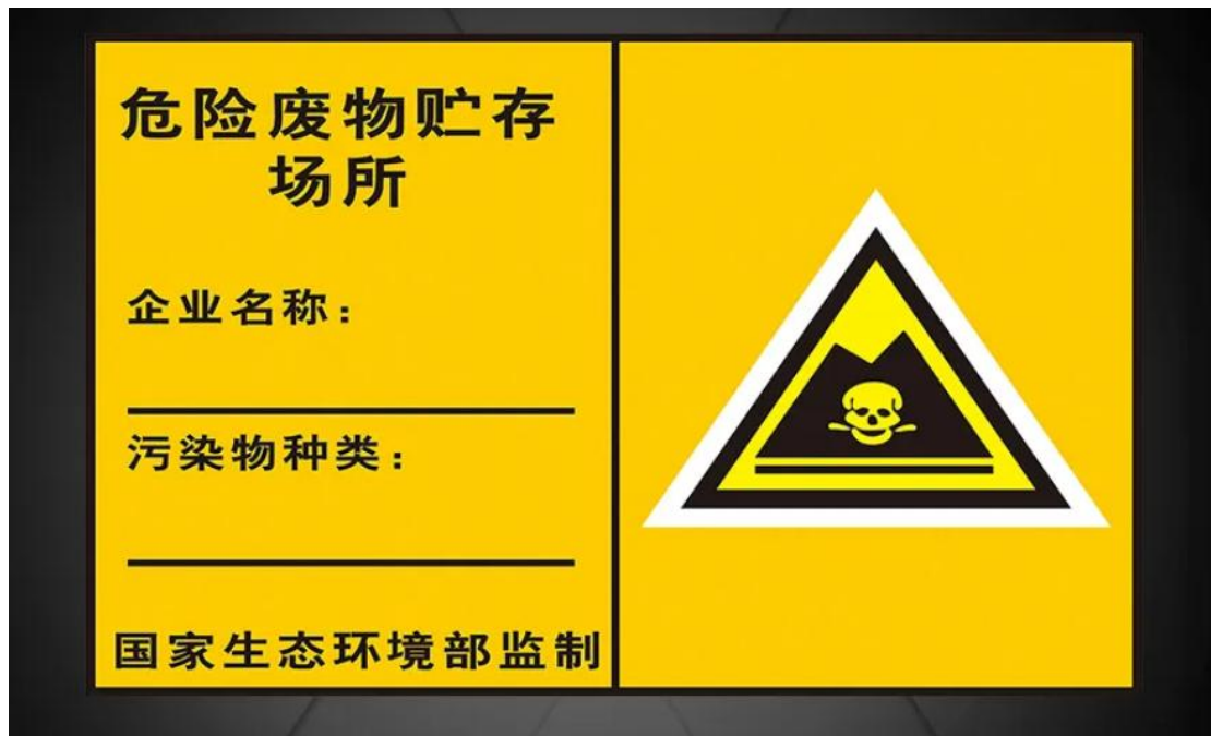
图 1 危险废物警示牌

(3) 对水体的污染：危险废物进入水域后，水质会下降，危害人类的用水健康。如果社会大众长期饮用这些被污染的水源及食用水生生物，它将直接危害人们的健康，严重的话甚至可能会直接引发死亡现象。