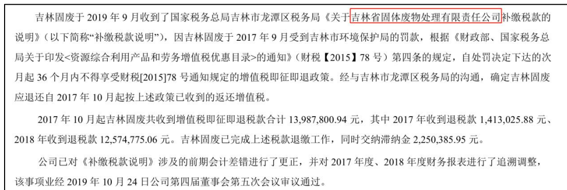
图 3 万邦达 2019 年年报披露税收优惠情况

上市公司北京清新环境技术股份有限公司（以下简称清新环境）（股票简称清新环境 代码 002573）间接控股 50%以上的关联企业新疆金派环保科技有限公司（以下简称金派环保），因 2019 年 4 月 15 日对有色金属干法车间改造项目未批先建，被在地生态环境部门罚款 4.8 万元（见图 4）。根据财政部、国家税务总局《关于资源综合利用产品和劳务增值税优惠的通知》（财税[2015]78 号），该企业将会暂停享受资源综合利用增值税即征即退优惠政策。清新环境在 2021 年度报告中就金派环保受到环保处罚并影响税收优惠的事宜进行情况说明。见图