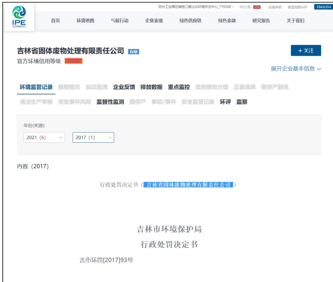
图 2 吉林省固体废物处理有限公司环境监管记录情况