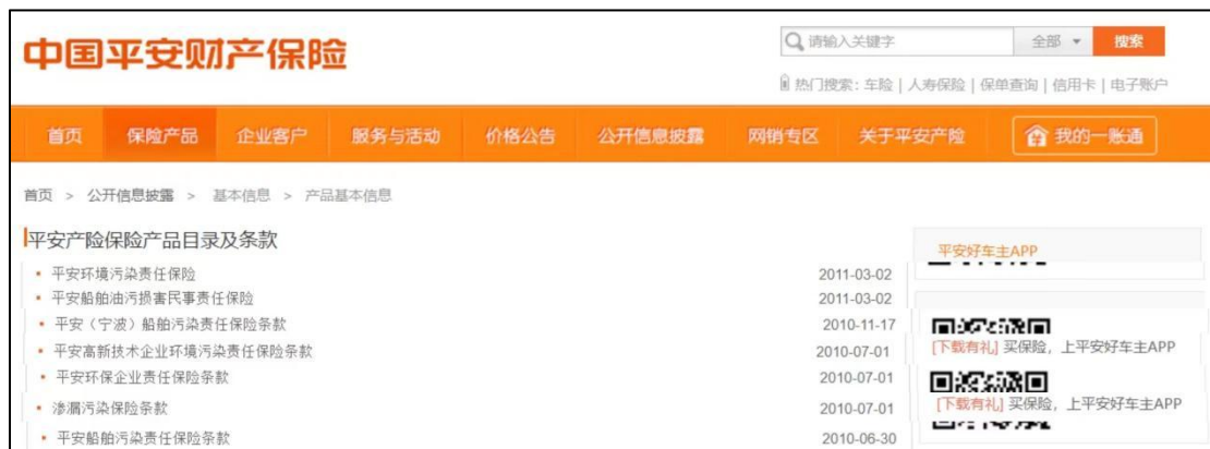
图4 平安产险部分ESG风险保险产品披露情况

通过梳理31家保险公司披露的ESG风险保险产品，绿色江南发现31家保险公司在披露了环境污染责任保险的基础上，均披露了其他类别的ESG风险保险产品。如中国人保财险披露了载运危险化学品船舶污染责任保险、沿海船舶燃油污染责任保险等，平安产险披露了船舶污染责任保险、渗漏污染保险等。极少有保险公司披露道路危险货物承运人污染责任保险，碳相关的保险。