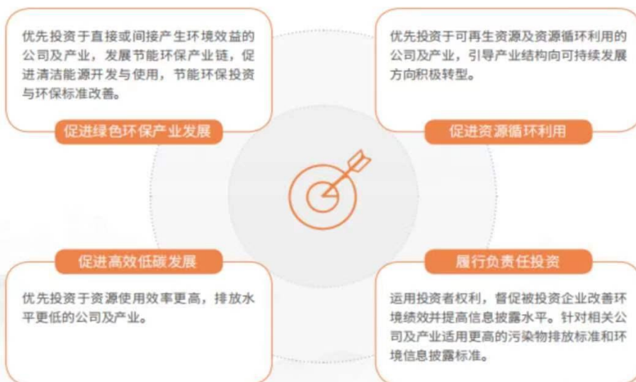
人保财险 2021 年绿色投资方向