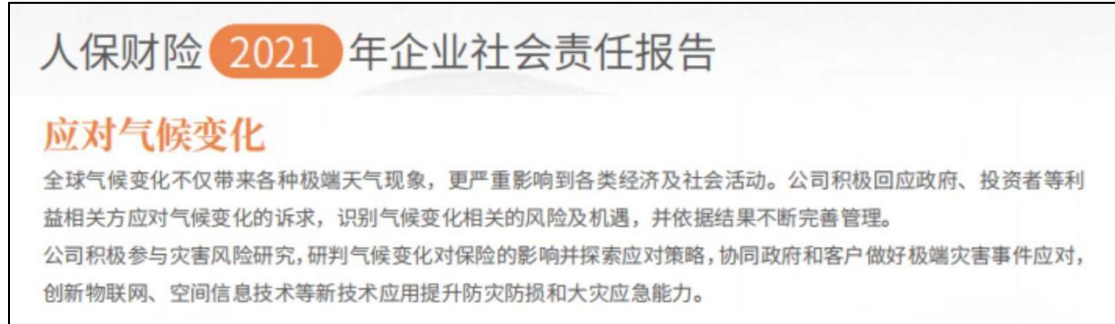
图 5 中国人保财险应对气候变化板块

纵观此次参评的 31 家保险公司的网站、年报、社会责任报告等，仅发现一家保险公司——中国人保财险在其社会责任报告中涉及气候变化风险，且内容也相对简单，仅提出“在应对气候变化时，公司不仅积极应对和识别其带来的风险及机遇，并依据结果不断完善管理”。