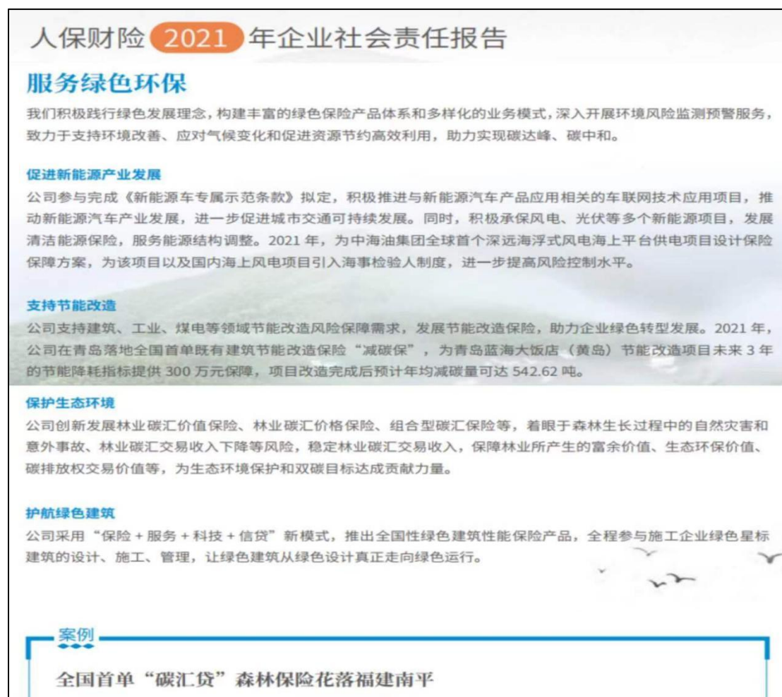
图 7 中国人保财险低碳行动板块

而中国人保财险涉及的碳相关内容相对比较丰富，既有低碳行动措施，又有相关案例。且 2021 年公司开创多项“首个”，包括在青岛落地全国首单既有建筑节能改造保险“减碳保”，为青岛蓝海大饭店（黄岛）节能改造项目未来 3 年的节能降耗指标提供 300 万元保障，项目改造完成后预计年均减碳量可达 542.62 吨，以及与福建省顺昌县国有林场签订全国首单林业碳汇价格损失保险等。