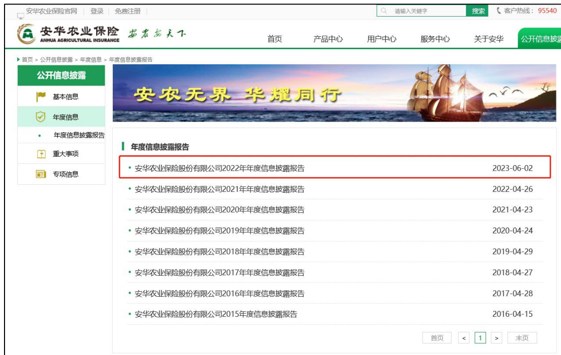
图2 安华农业的年报披露时间

根据观察，45家财险公司中仅安华农业的年报披露时间在4月30日之后，且其官网也无年报暂缓披露的公告。《保险公司信息披露管理办法》第三十四条规定，“未按照本办法的规定披露信息的，由中国银行保险监督管理委员会依据法律、行政法规进行处罚。”因此，安华农业若需延迟披露年报，理应公布不能按时披露的原因以及预计披露时间，以免被国家金融监督管理总局处罚。