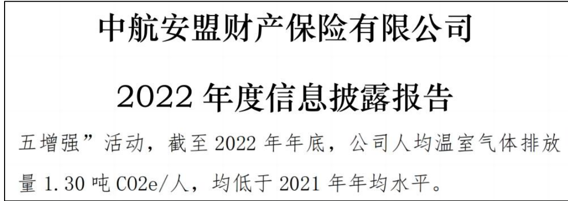
图 4 中航安盟碳强度披露情况

在碳排放和能源消耗方面，人保财险与鼎和保险均披露了相关数据，而中国大地保险仅披露了能源消耗情况，中航安盟仅披露了碳排放强度 7 。