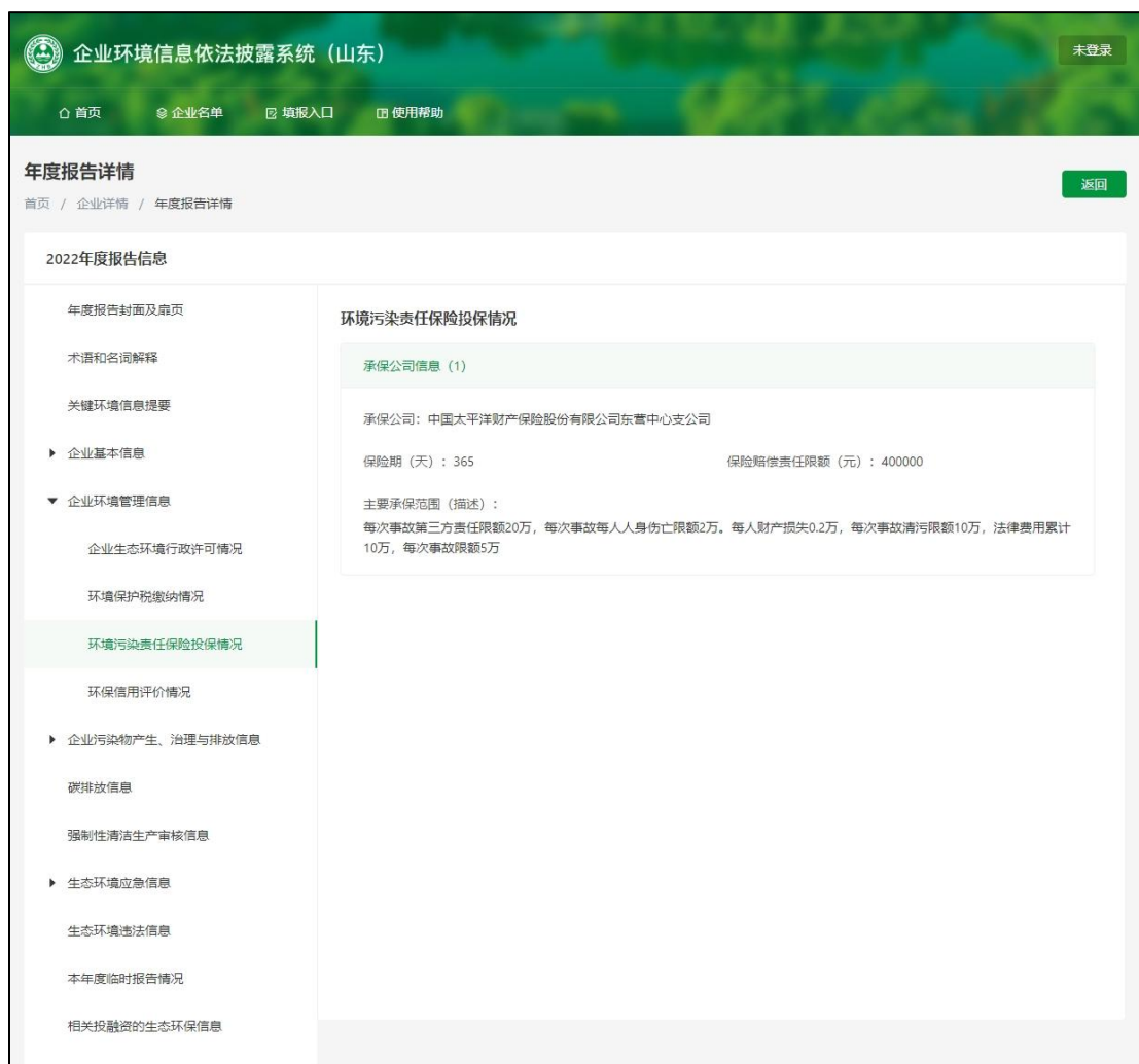
图 7 环责险披露情况（以东营德佑环保科技有限公司为例）