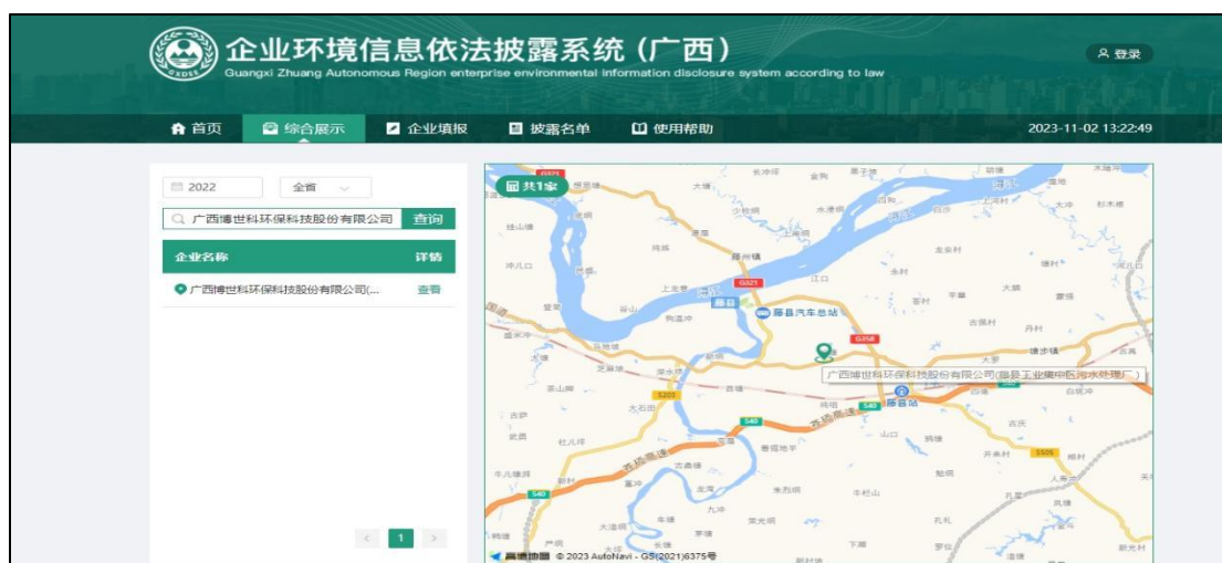
图 4 广西省企业环境依法信息披露系统检索情况