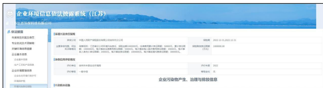
图 11 江苏弘德环保科技有限公司致函前后披露对比

库伦旗金圆东蒙环保科技有限公司表示不清楚企业为何未填报环责险信息的情况，也不清楚具体是由哪个部门负责。