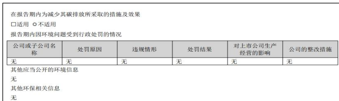
图 5 超越科技年报披露情况