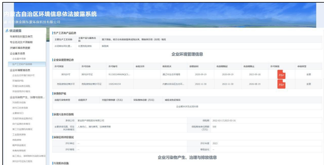
图10 库伦旗金圆东蒙环保科技有限公司披露情况