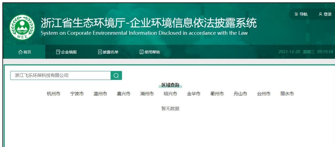
图 8 浙江飞乐环保科技有限公司年度环境信息报告检索情况

另外，广西科清环境服务有限公司和桂林高能时代环境服务有限公司在企业年度环境报告中写明“2022 年未投保环责险”。库伦旗金圆东蒙环保科技有限公司及华新绿源（内蒙古）环保产业发展有限公司在内蒙古企业环境信息依法披露系统中，均未披露《管理办法》第十二条规定的企业年度环境信息依法披露报告中应当披露的包括企业基本信息，企业环境管理信息，污染物产生、治理与排