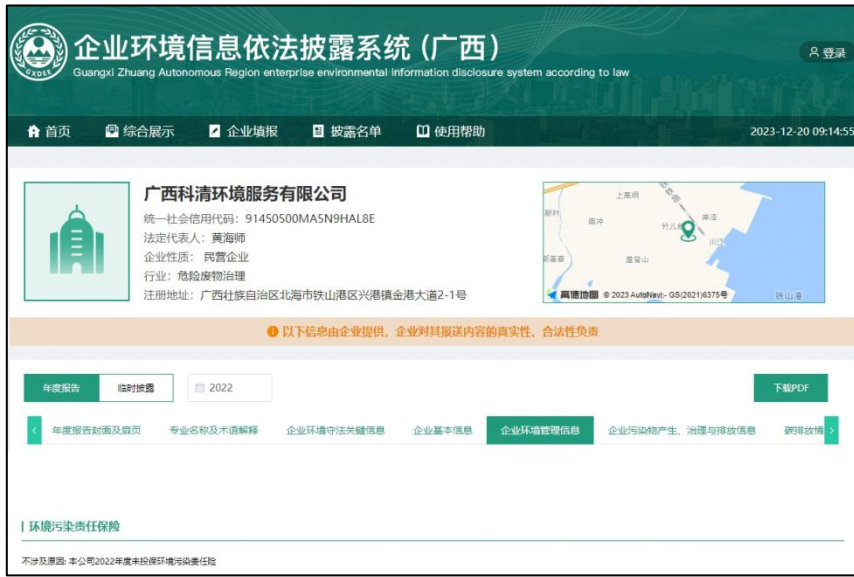
图9 广西科清环境服务有限公司披露情况