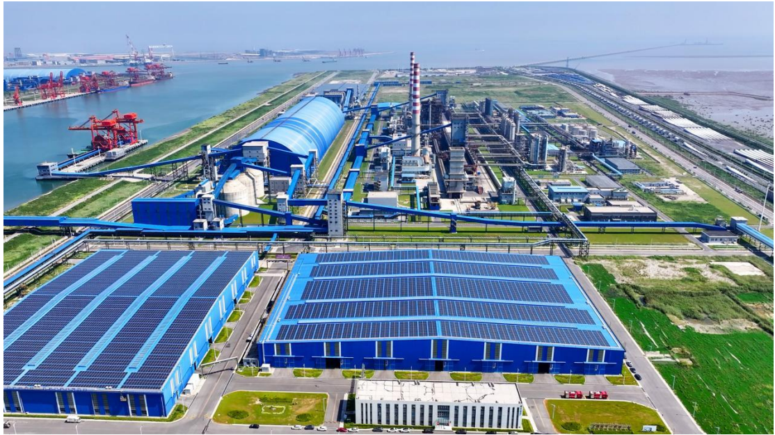
图 2 南通中天钢铁（绿色江南航拍）

根据绿色江南长期在一线调研的结果可以直观看出，企业现场环境管控进步明显，仅在大气污染物治理方面，我们观察到越来越多的企业从原来无组织排放废气粉尘逐渐转变为采用先进的环保设备与措施进行收集处理，谋求绿色发展。例如在对某钢铁企业调研过程中我们了解到，近年来为打造全省钢铁行业绿色安全标杆企业，该企业实施了钢铁企业超低排放技术改造，将发电厂脱硫改造为全烟气脱硫除尘系统，原有球团、焦炭露天料场改造为钢结构密闭堆场，安装了一套完整的烟气连续检测系统，并在轧钢加热炉上采用脱硫脱硝烟气一体化处理工艺，一系列设备升级改造的投入超 3.6 亿元。这一变化凸显了传统高污染企业在环境治理方面正逐渐从被动应对转向主动参与，显示出它们在环境保护上的重视程度和行动力有了显著提升。在这个转变过程中，环保税对企业决策的直接影响不容忽视，其直观的经济激励机制起到了关键性的作用。