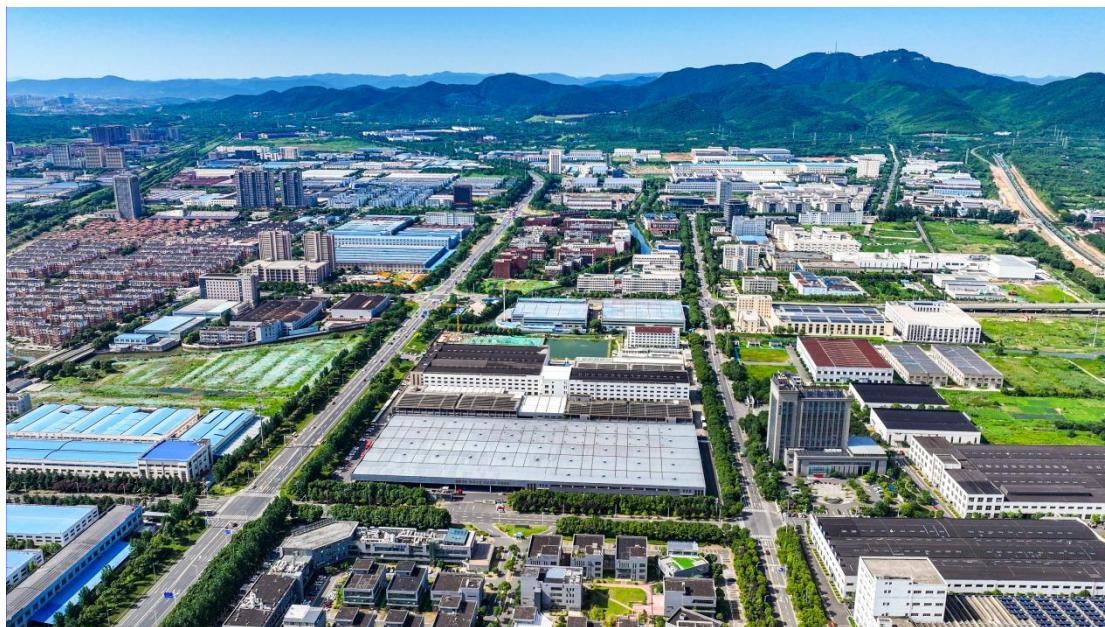
图 3 以环保产业制造为特色的宜兴环保科技工业园

方面得益于企业为应对环保税影响而显著增加的环保相关市场需求,另一方面也得益于环保税引导金融资本从投资回报率日益下降的高污染行业流动至更具经济发展潜力的环保绿色低碳产业。