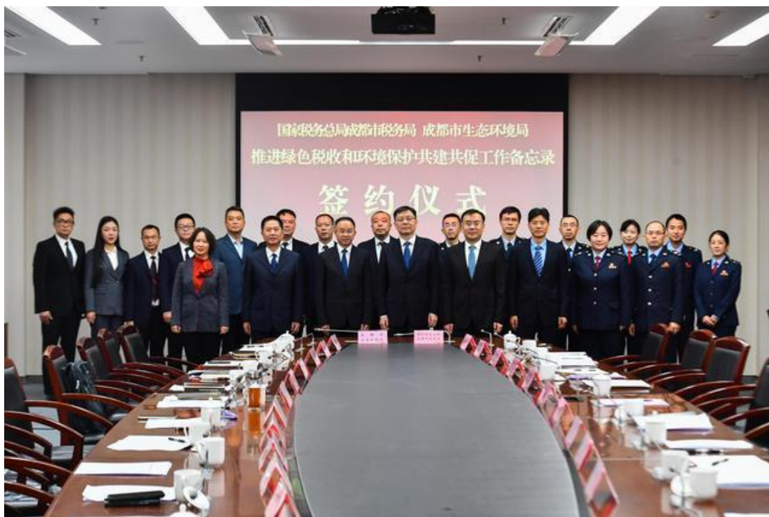
图 4 税务与生态环境部门合作的新闻报道图片

绿色江南在与在地税务部门的日常工作合作中了解到，多地税务局与在地生态环境局已建立良好环境信息共享机制。例如，青岛税务部门与生态环境部门打通数据壁垒，建立环境数据信息共享机制，两部门按月共享污染源自动监测、排污许可等涉税信息，实现环境保护税申报“免填单”服务，申报准确率大幅提升。 8 我们始终相信建立信息共享机制是政府部门间良好协作的基础，对于提升整体治理能力具有重要意义。