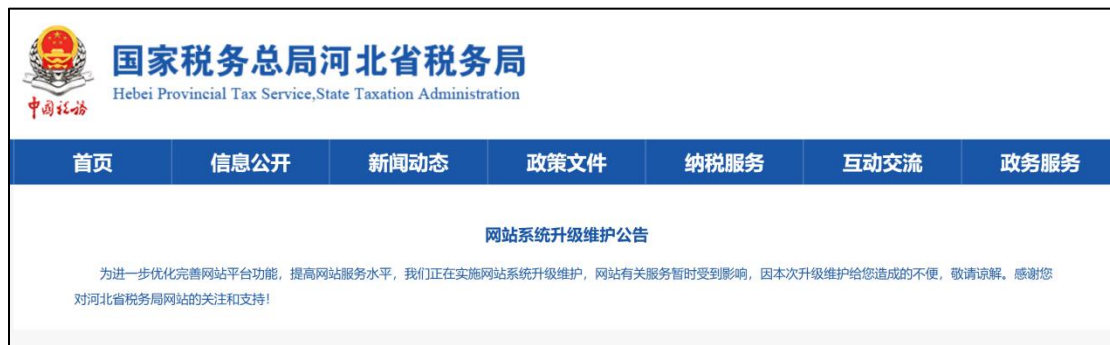
图 6 河北省税务局网站系统维护中

造成此现象的主要原因在于环保税的征管工作涉及税务和生态环境等多个部门,然而在实际操作中相关部门数据信息公开共享与协同合作水平还有待提升。首先,部分地区相关部门缺乏有效的信息共享机制,导致最新的污染物排放数据不能及时从生态环境部门传递到税务部门,这种信息沟通滞后不仅影响了税务机关对纳税人应缴税款的准确计算,也给企业财税工作带来不必要的负担。其次,绿色江南通过检索发现,目前各省(区、市)基本均建立了统一的信披平台用以披露企业的年度环境信息,但部分地区(贵州、广西、河北、北京、浙江)信披系统时常会出现无法打开的情况,稳定性欠佳。这种由于各地信息披露数据平台建设标准不统一或技术水平差异等原因,造成的数据格式不兼容、内容缺失等情况,进一步阻碍了各方的有效合作。