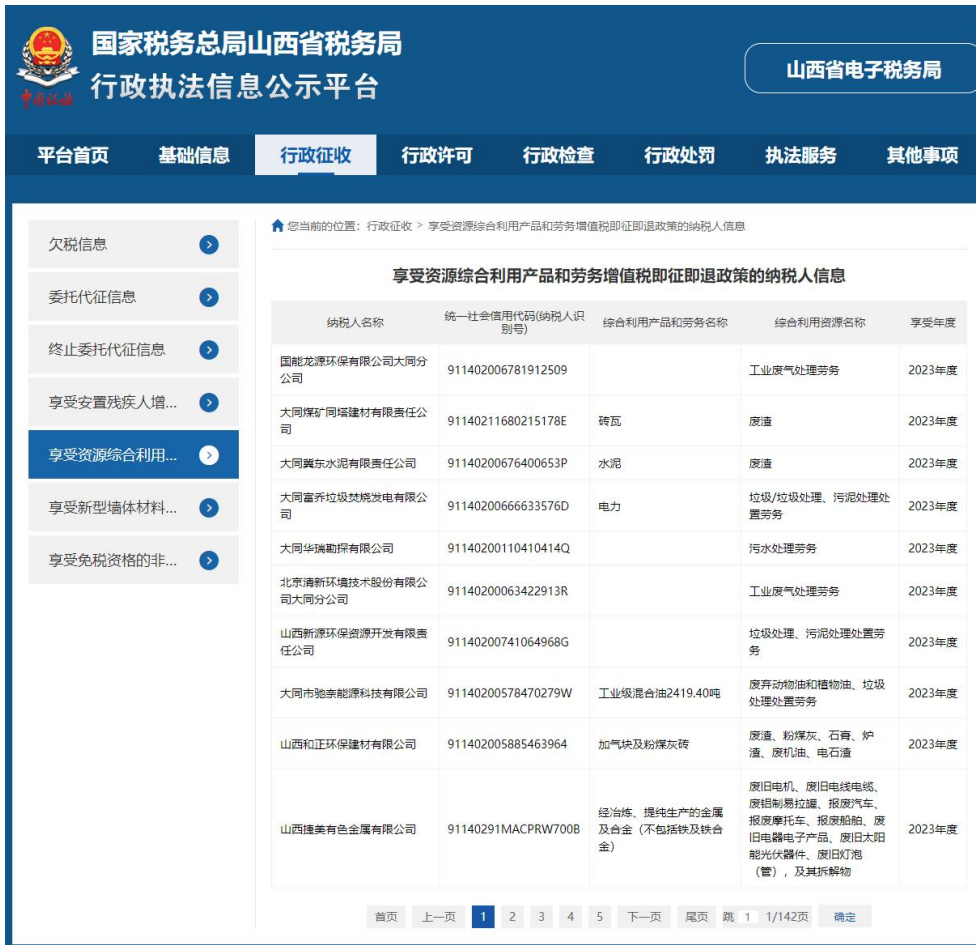
图 6 山西省税务局官网 7