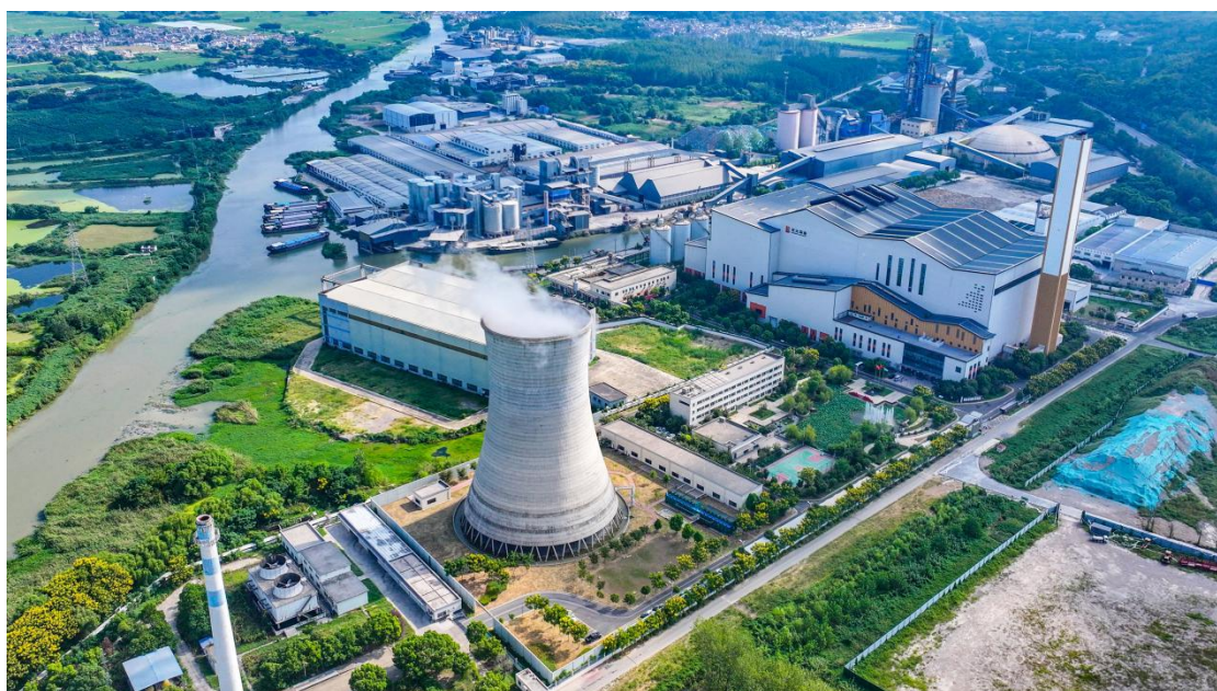
图2 江苏省某垃圾焚烧发电企业

绿色江南结合税务局官网公示的“2023年全国各省市享受资源综合利用增值税即征即退的名单”（图2），发现共有13589家资源综合利用企业享受税收优惠（江西、山西、黑龙江除外）。其中江苏、山东（含青岛）、安徽、河南享受资源综合利用增值税即征即退的企业数最多，达到1000家以上（图2）；浙江（含宁波）、湖北、四川、浙江、湖南、广东（含深圳）、河北、辽宁（含大连）次之，达到500家以上；青海、吉林、西藏享受退税的企业最少，不到50家（图3）。这一数据背后反映出我国不同地区间资源综合利用水平存在显著差异，而造成这种区域发展不平衡的主要因素包括当地的经济状况、技术