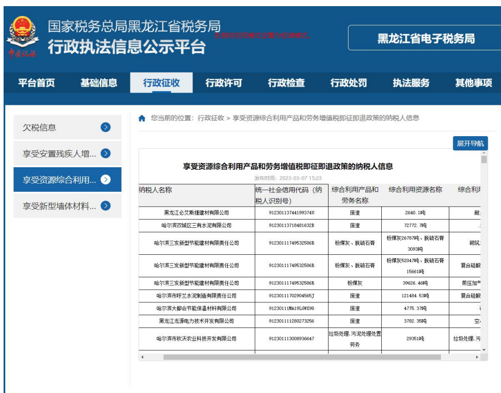
图 5 黑龙江省税务局官网 6

类似的情况也出现在黑龙江省税务局官网上，其公布的名单同样停留在 2023 年（图 5）。