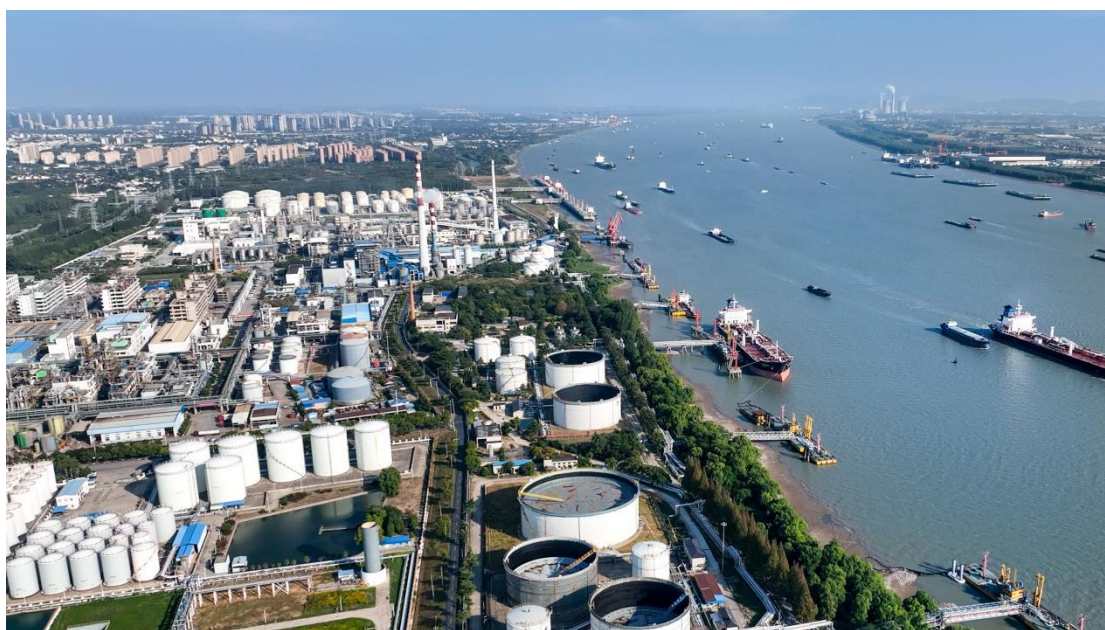
图1 江苏扬子江国际化学工业园“无废园区”建设实践

2024年,国务院办公厅发布《国务院办公厅关于加快构建废弃物循环利用体系的意见》,提出“遵循减量化、再利用、资源化的循环经济理念,以提高资源利用效率为目标,以废弃物精细管理、有效回收、高效利用为路径,覆盖生产生活各领域,发展资源循环利用产业,健全激励约束机制,加快构建覆盖全面、运转高效、规范有序的废弃物循环利用体系。” 2 随着国家对环境保护和资源节约的日益重视,在“城市矿产”、“无废城市”、“循环经济”等理念指导下,资源综合利用市场规模持续扩大(图1)。