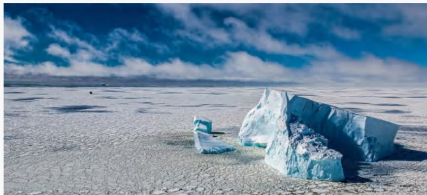
—— 南极洲别林斯高晋海的冰山 ——

1月30日，世界气象组织指出，1月全球多地同时遭受酷暑和野火、破纪录寒潮和暴雪，以及毁灭性暴雨和洪涝灾害的侵袭，这一极端天气在全球多地造成严重的经济、环境及人员损失。（本文摘自联合国新闻）