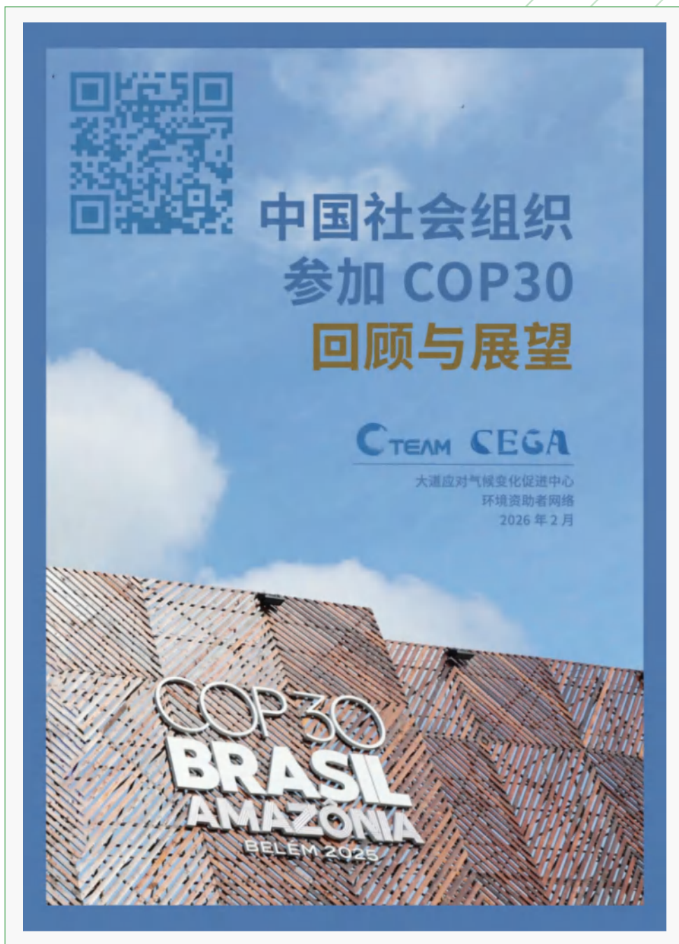
—— 报告封面 ——

3月2日，大道应对气候变化促进中心（C Team）与环境资助者网络（CEGA）联合发布了《中国社会组织参加COP30回顾与展望》报告。这是继去年首份回顾报告后的第二份年度观察，系统梳理了中国社会组织在2025年11月巴西贝伦COP30期间的参与实践，并展望2026年COP31行动方向。（本文摘自环境资助者网络CEGA公众号）