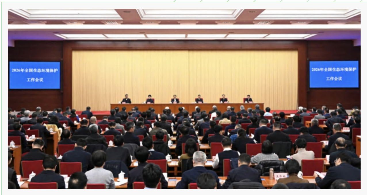
—— 2026年全国生态环境保护工作会议在京召开 ——

1月14日至15日，生态环境部在京召开2026年全国生态环境保护工作会议。会议强调，今后五年是基本实现社会主义现代化夯实基础、全面发力的关键时期，也是美丽中国建设承上启下、实现生态环境根本好转的关键时期。要牢固树立和践行绿水青山就是金山银山的理念，坚持以美丽中国建设为统领，以碳达峰碳中和为牵引，协同推进降碳、减污、扩绿、增长，筑牢生态安全屏障，增强绿色发展动能，绘就各美其美、美美与共的美丽中国新画卷。要突出一个抓手，以碳达峰和绿色低碳转型推进源头治理。促进经济社会发展绿色化、低碳化，强化降碳减污目标协同、政策协同、措施协同，从源头减少污染物和碳排放。（本文摘自生态环境部官网）