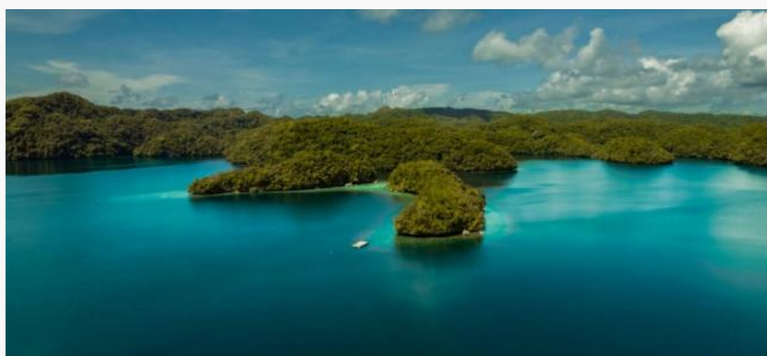
—— 帕劳岛的生物多样性受到海平面上升的威胁 ——

2月23日，联合国教科文组织政府间海洋学委员会（IOC）发布的一项新报告指出，人们对海洋如何吸收和储存碳的认识存在严重不足。这一关于地球最大碳汇的显著不确定性，可能导致当前气候预测出现偏差，并阻碍我们未来几十年制定有效减缓和适应策略的能力。（本文摘自联合国新闻）