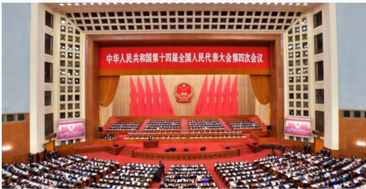
—— 中华人民共和国第十四届全国人民代表大会第四次会议 ——

2026年政府工作报告对加快推动全面绿色转型作出系统部署，“未来能源”首次列入未来产业培育名单，“碳排放强度”首次成为年度约束性指标。从“能耗双控”到“碳排放双控”，从“管用量”到“管排量”，这是今年政府工作报告传递出的深刻变革。报告明确提出“实施碳排放总量和强度双控制度”，并首次将“单位国内生产总值二氧化碳排放降低3.8%左右”作为年度约束性指标。（本文摘自央广网）