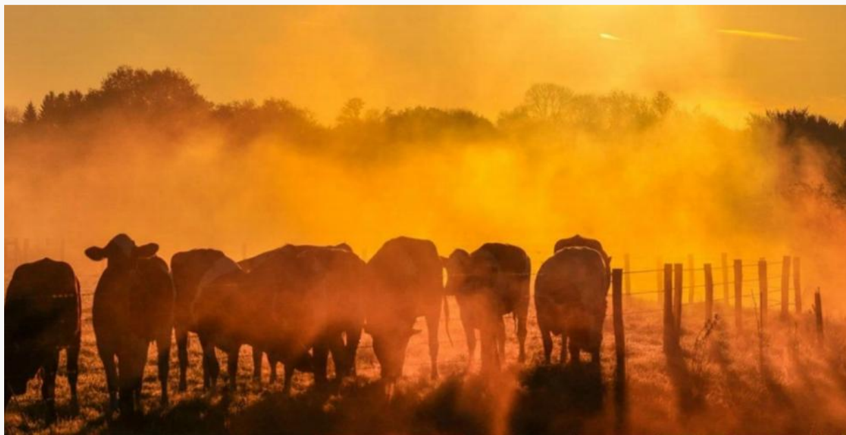
—— 2025年很可能成为有记录以来第二或第三暖的年份 ——

根据世界气象组织对八个数据集的综合分析，全球平均表面温度比1850至1900年的平均值高出了 1.44^{\circ}\text{C} 。其中两个数据集将2025年列为176年记录中第二热年份，另外六个将其列为第三热年份。在所有八个数据集中，过去三年（2023至2025年）均是最暖的三年。这三年综合平均气温比工业化前时代高出了 1.48^{\circ}\text{C} 。（本文摘自联合国新闻）